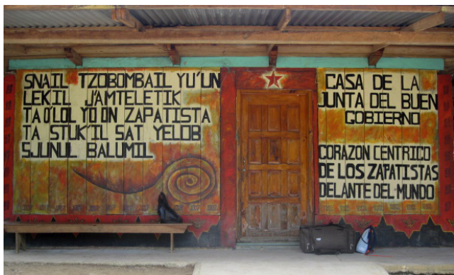
Caminar preguntando: maletas esperando fuera de la oficina de la Junta de Buen Gobierno de Oventik, Chiapas, 2009.