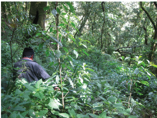
Compañero zapatista en las caminatas por la Reserva Autónoma Zapatista El Huitepec, 2010.