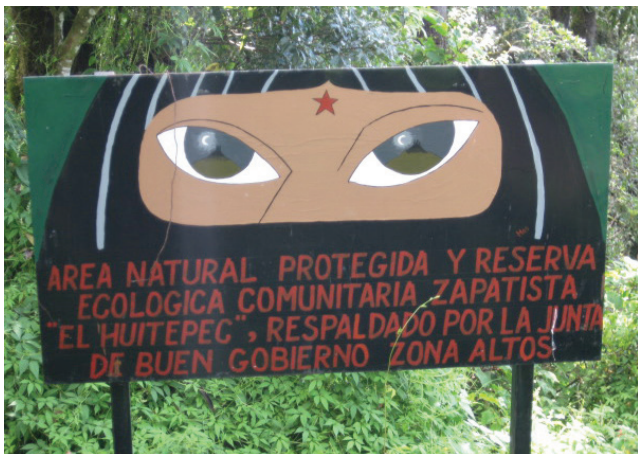
Letrero al ingreso de la Reserva Comunitaria Zapatista, Huitepec, San Cristóbal de Las Casas, Chiapas, 2010.