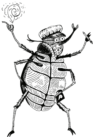
Don Durito , diseño para la colección Lecturas urgentes de Barullo Casa Taller, Cali, Colombia, 2019. Ilustración: Sebastián Giraldo.